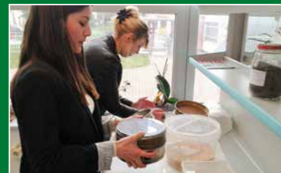
Studenti I. godine diplomskoga studija Zaštite bilja na laboratorijskim vježbama iz modula Skladištenje poljoprivrednih proizvoda