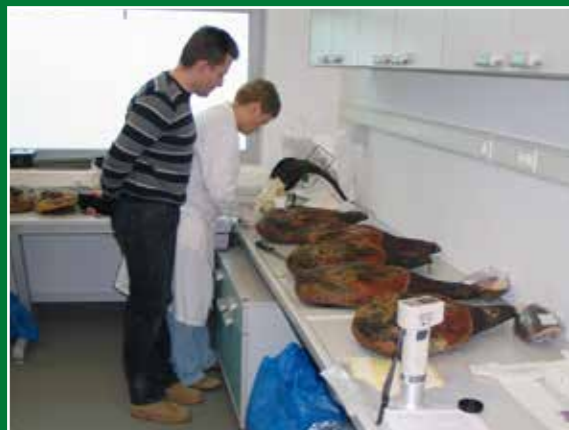
Analiza slavonskih šunki iz pokusa