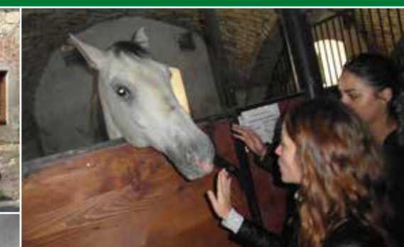
Terenske vježbe iz modula Konjogojstvo