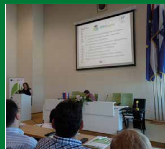
Početna konferencija, 21. srpnja 2015.