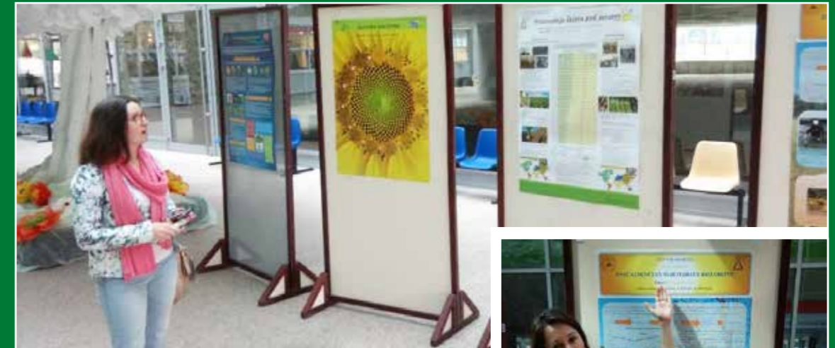
Izložba postera s temom Sunce