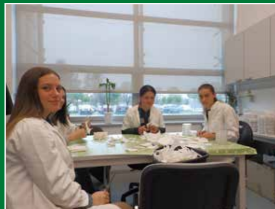
Modul Ekološki prihvatljiva zaštita bilja