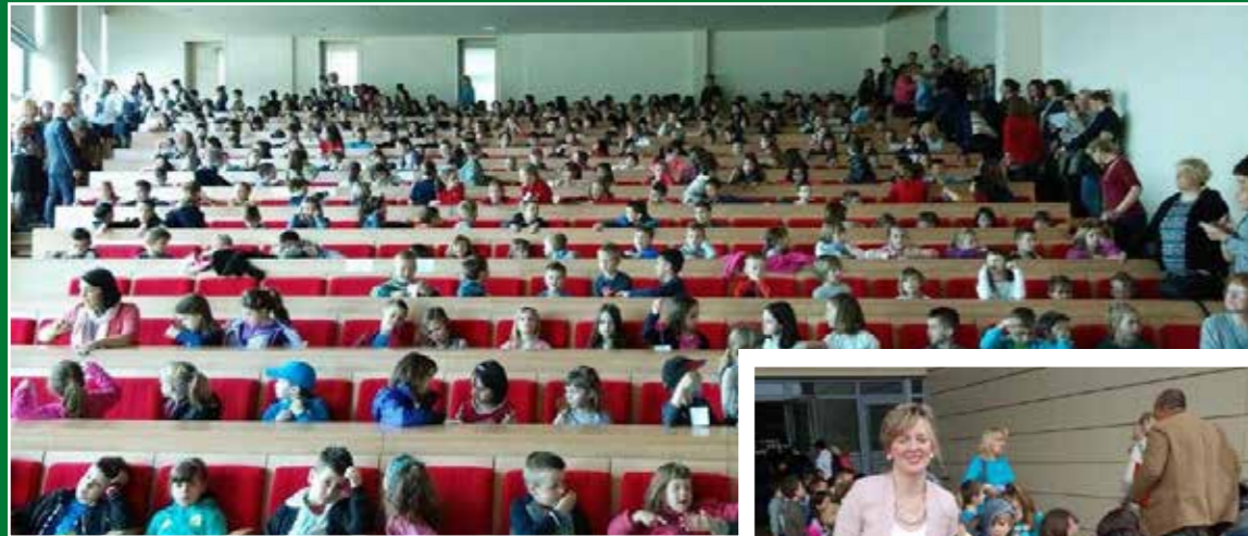
Svečano otvaranje Dana otvorenih vrata Poljoprivrednog fakulteta u Osijeku, 24. travnja, 2015.