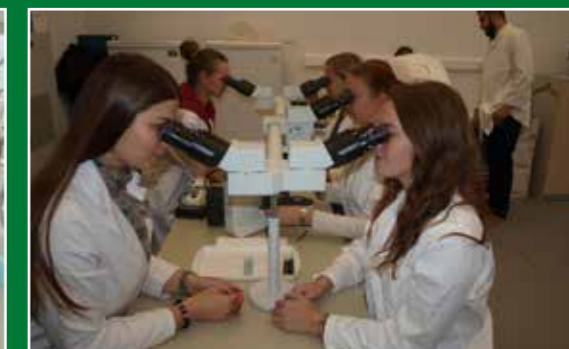
Vježbe u Laboratoriju za fitopatologiju sa studentima diplomskoga studija Zaštita bilja