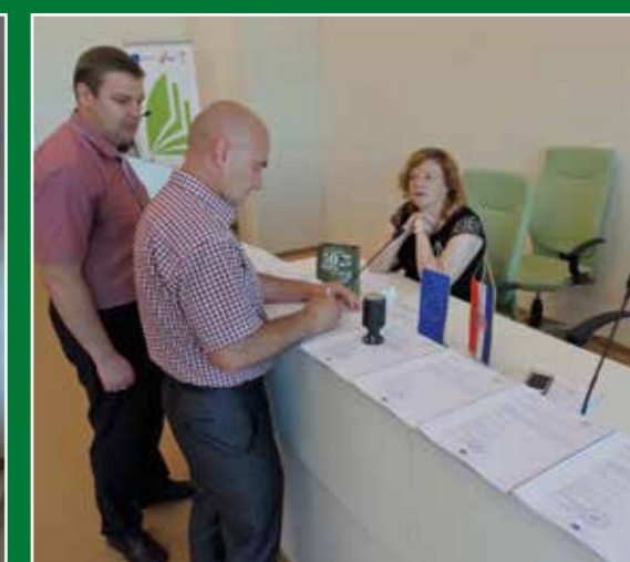
Potpisivanje Ugovora, 21. srpnja 2015.