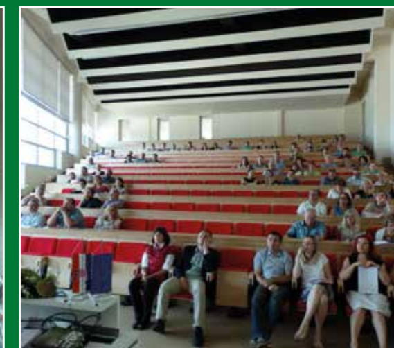
Predstavljanje timova, 16. srpnja 2015.