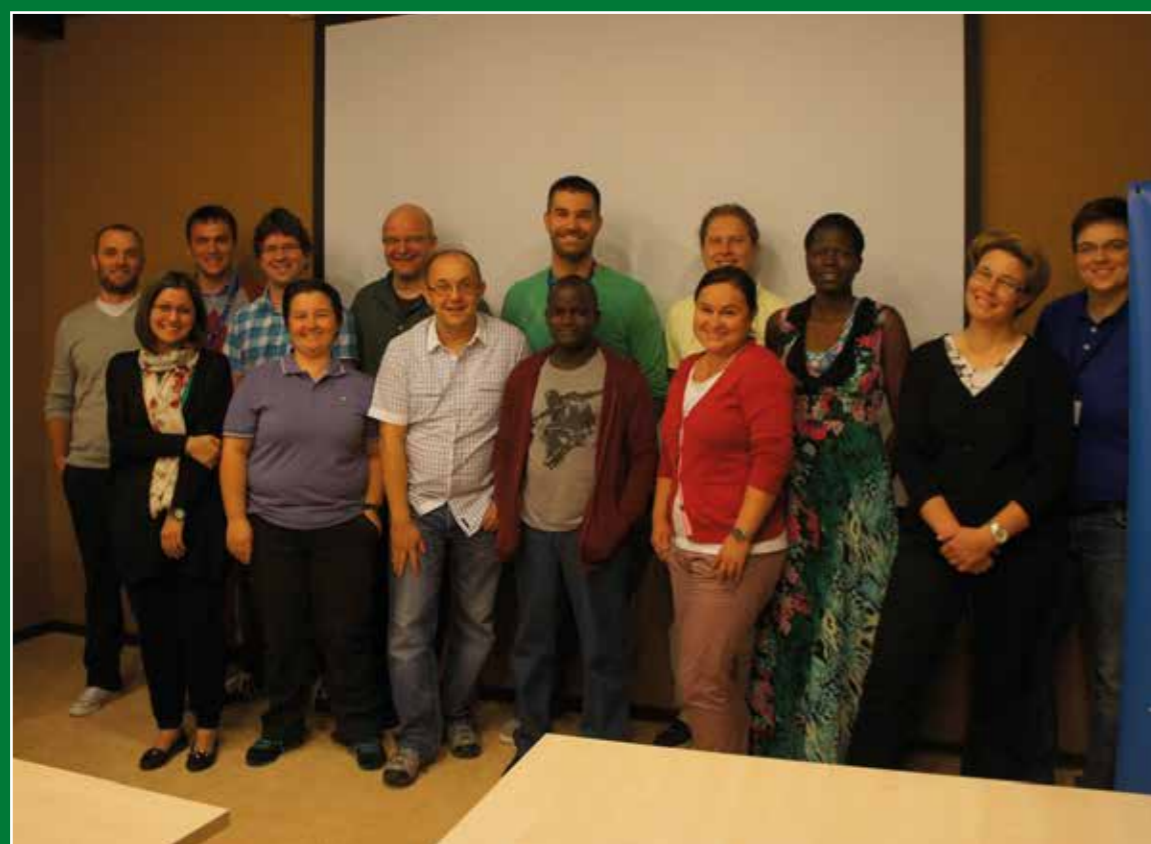
Sudionici radionice (Workshop-a) u organizaciji simpozija „Animal Science Days“, pod nazivom „Inbreeding and inbreeding depression; theory with practical examples“, rujna 2015.

Simpozij „Uzgoj divljači i zaštita biološke raznolikosti: Vučedolska golubica - poljska jarebica“, Vukovar 15. travnja 2015.