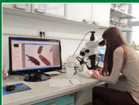
Studenti I. godine diplomskoga studija Zaštite bilja na laboratorijskim vježbama iz modula Skladištenje poljoprivrednih proizvoda