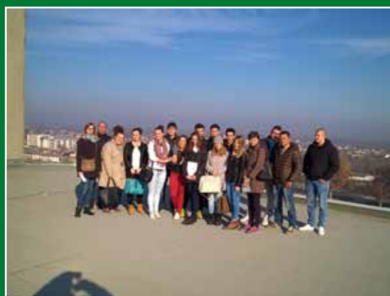
Posjet studenata III. godine stručnog studija Bilinogojstvo silosima „Žito“ u Osijeku