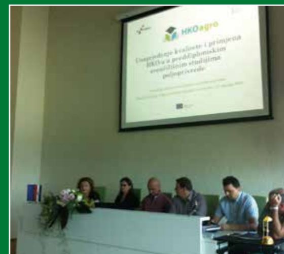
Predstavljanje projekta, 30. lipnja 2015.